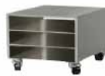
MESA INOX 600x1050x800 mm Mesa universal inox con ruedas.