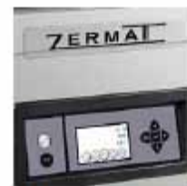
PANEL CONTROL LED Vacío efecto pulmón (especial líquidos).