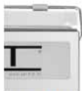
TAPA PLANA Tapa plana metacrilato.