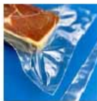
CORTE SOBRANTE BOLSAS Barra de sellado con corte.