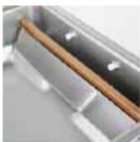
INYECCIÓN DE GAS Instalación para inyección de gas inerte en bolsa.