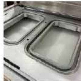
MOLDE FIJO Con corte perimetral de dos bandejas