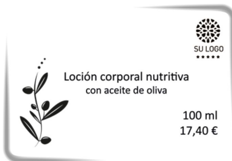
tarjetas de precio para tiendas

Tarjetas de acceso a los servicios ofrecidos: controlar, visualmente o con un código de barras impreso en las tarjetas a las personas que acceden a sus espacios VIP, spa, golf o casino