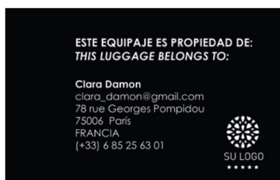
tarjetas para equipaje

Credenciales para el personal: identificar a los miembros de tu personal con tarjetas de identificación de gran calidad y añadir los idiomas que hablan por ejemplo.