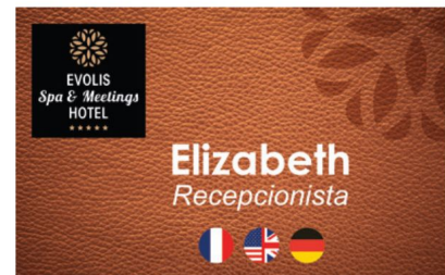
Credenciales para el personal

Tarjetas de precio para tiendas: crear tarjetas de precio fáciles de leer y personalizadas para todos los productos disponibles en sus tiendas.