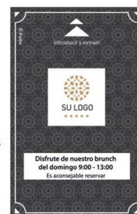
tarjetas de acceso a habitaciones

Tarjetas para equipaje: ofrecer a los clientes un distintivo que llame su atención proponiéndoles tarjetas para equipaje con tus datos.