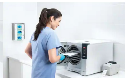
Diseño ergonómico Compacto y práctico Su tamaño compacto facilita su integración en el entorno