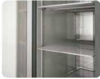
DETALLE INTERIOR PARRILLAS CON SOPORTES INTERIOR DETAIL GRILLS