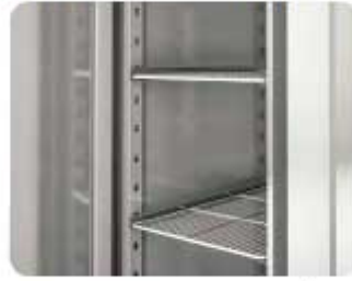
DETALLE INTERIOR PARRILLAS CON GUÍAS INTERIOR DETAIL OF GRILLS WITH GUIDES