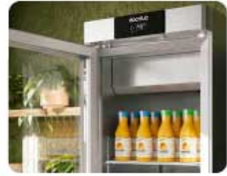
DETALLE ACABADO CABEZA Y PUERTA VIDRIO DETAIL OF THE HEAD AND GLASS DOOR